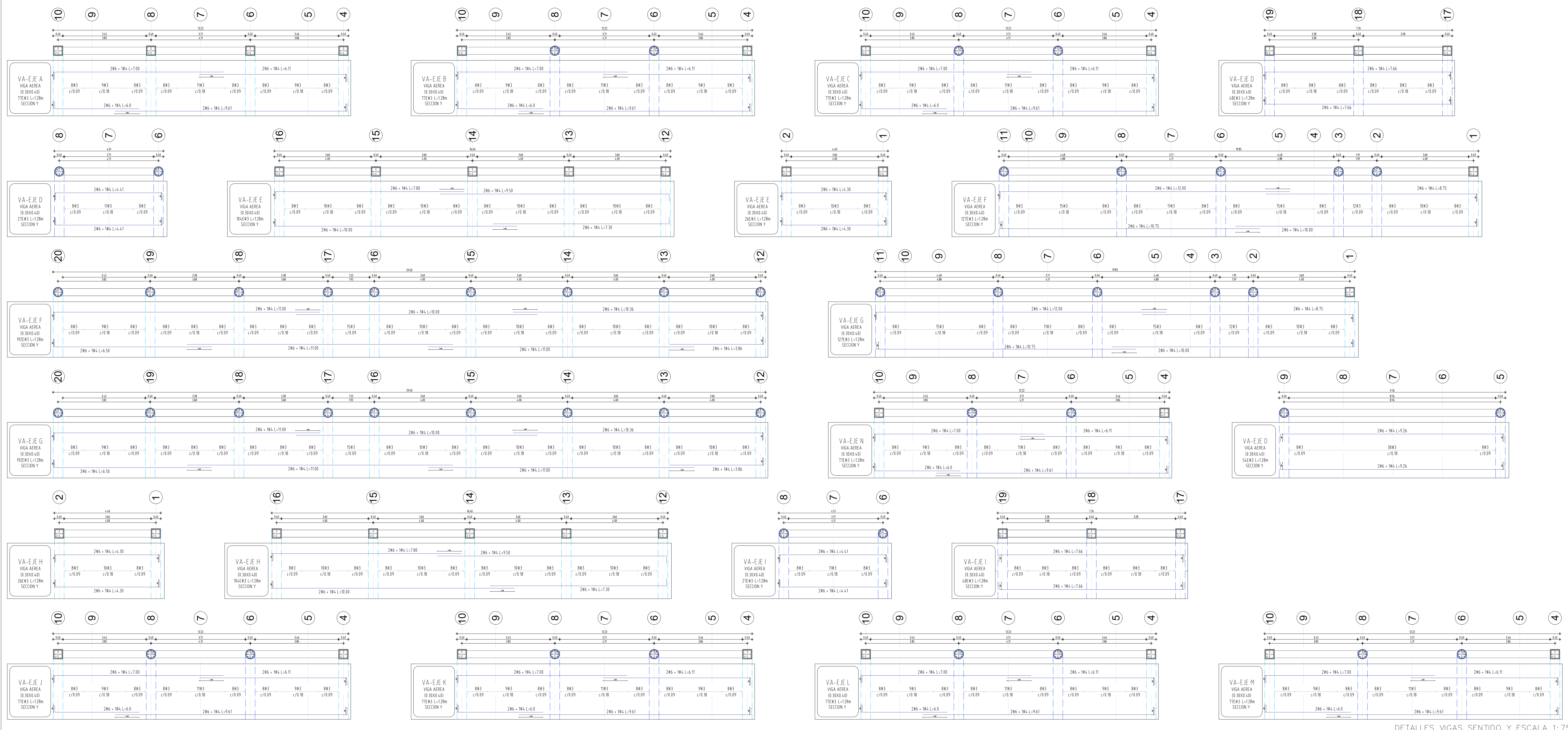
DETALLES VIGAS SENTIDO Y ESCALA 1:75