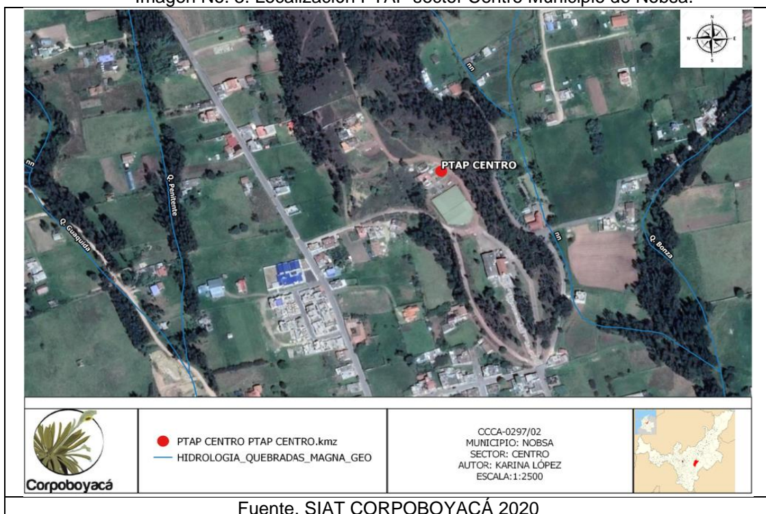
Imagen No. 3. Localización PTAP sector Centro Municipio de Nobsa.

El área que corresponde al sitio en donde opera la Planta de Tratamiento de Agua Potable Sector Centro, se encuentra ubicada en el punto de coordenadas Latitud: 5° 46' 35.9" N, Longitud: 72° 56'29.9", a una elevación de 2561 m.s.n.m. Dicha planta abastece a los barrios del casco urbano como "Camilo Torres" y veredas de Guátaquida Alto y Guátaquida Bajo.