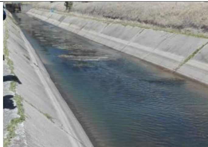
Foto 4. Estado del Canal Abierto.