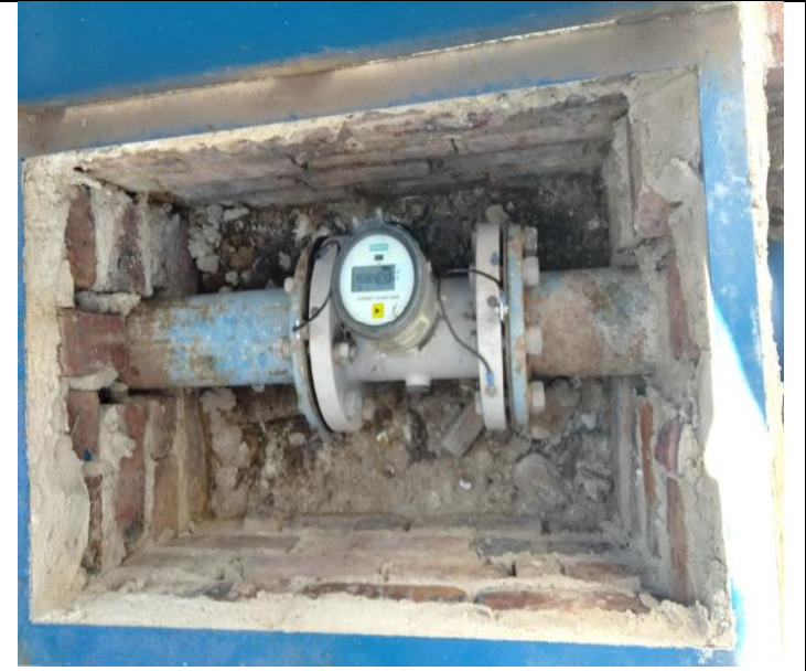
Foto 7. Macromedidor PTAP zona centro.