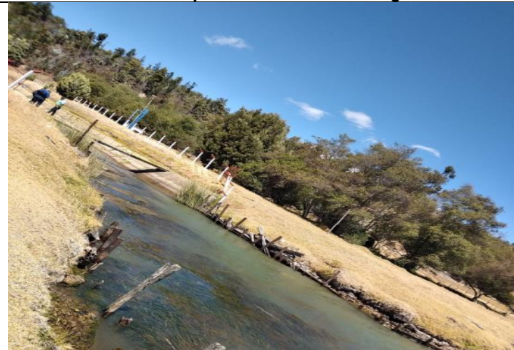
Foto 3. Conservación de la fuente