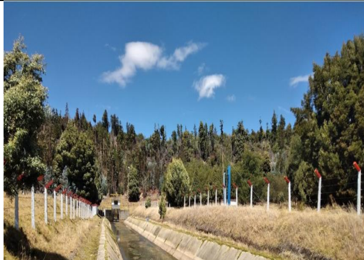
Foto 1. Estado de protección ambiental Lago de Tota