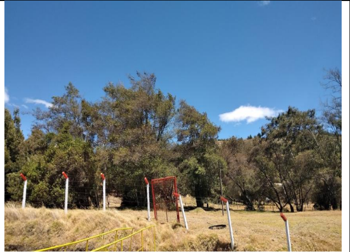
Foto 2. Protección de la fuente