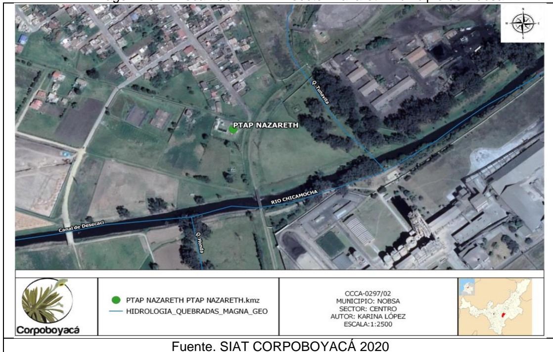
Imagen No. 2. Localización PTAP sector Nazareth Municipio de Nobsa.

El área que corresponde al sitio en donde opera la Planta de Tratamiento de Agua Potable Sector Centro, se encuentra ubicada en el punto de coordenadas Latitud: 5° 46' 35.9" N, Longitud: 72° 56'29.9", a una elevación de 2561 m.s.n.m. Dicha planta abastece a los barrios del casco urbano como "Camilo Torres" y veredas de Guátaquida Alto y Guátaquida Bajo.