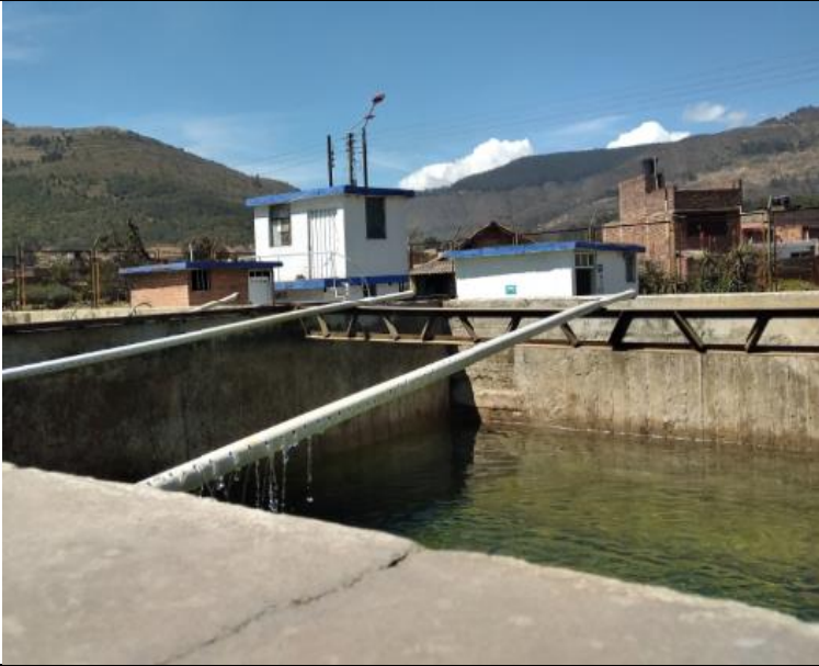
Foto 4. PTAP Nazareth.