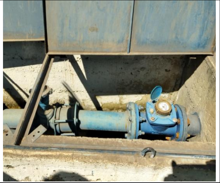
Foto 5. Macromedidor PTAP Nazareth