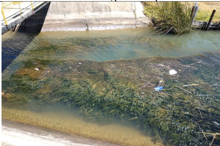
Foto 3. Estado del punto de Captación.