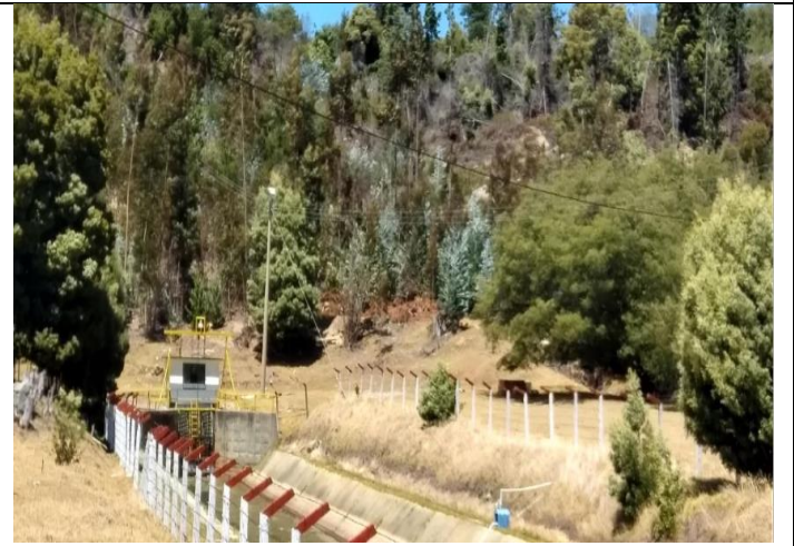
Foto 4. Vegetación arbórea aledaña a punto de captación.