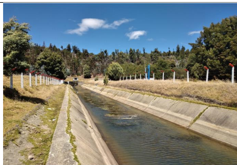
Foto 1. Canal abierto, punto de captación.