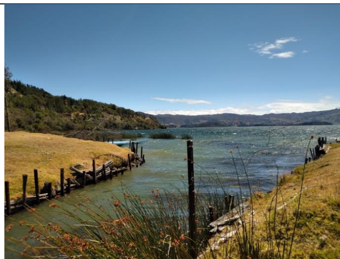
Foto 2. Entrada del recurso hídrico al canal abierto-