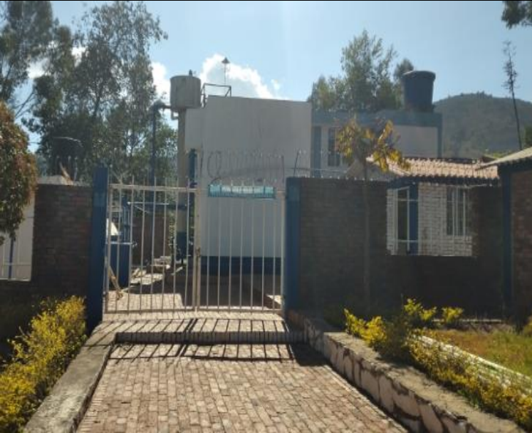
Foto 6. PTAP zona centro.