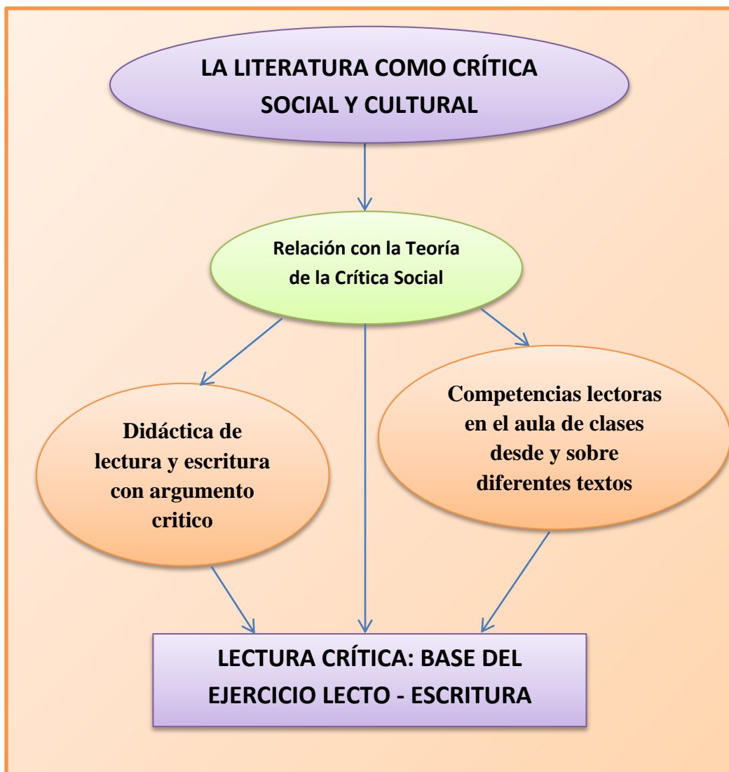
Gráfica Nª 3:

explorado en el aula de clases asociando los tres frentes del trabajo investigativo: literatura, crítica social y pedagogía: