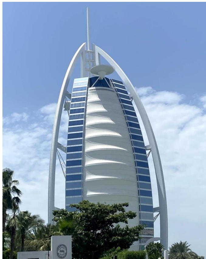
Figura 3 Hotel Burj Al Arab.

Nota. Imagen fotográfica tomada por el autor