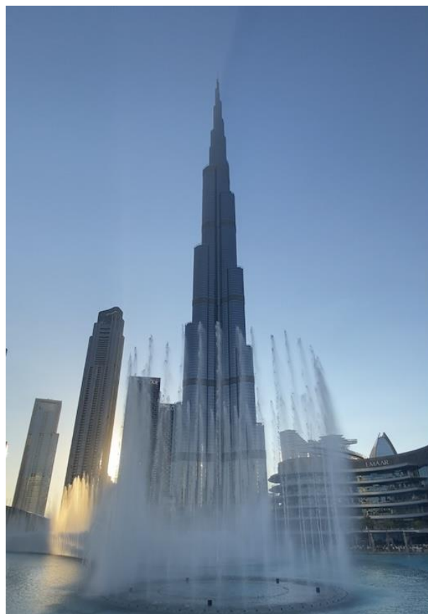
Figura 1 Burj Khalifa.

Nota. Imagen fotográfica tomada por el autor