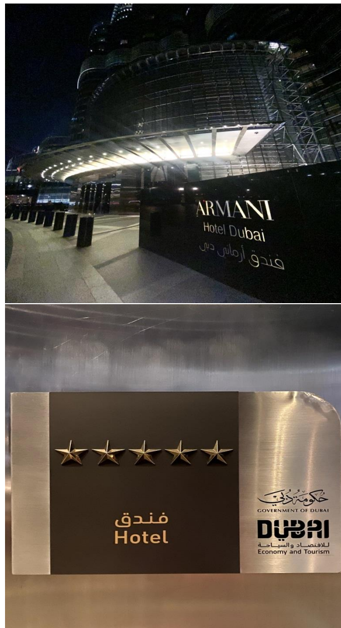
Figura 5 Hotel Armani.

Nota. Imagen fotográfica tomada por el autor