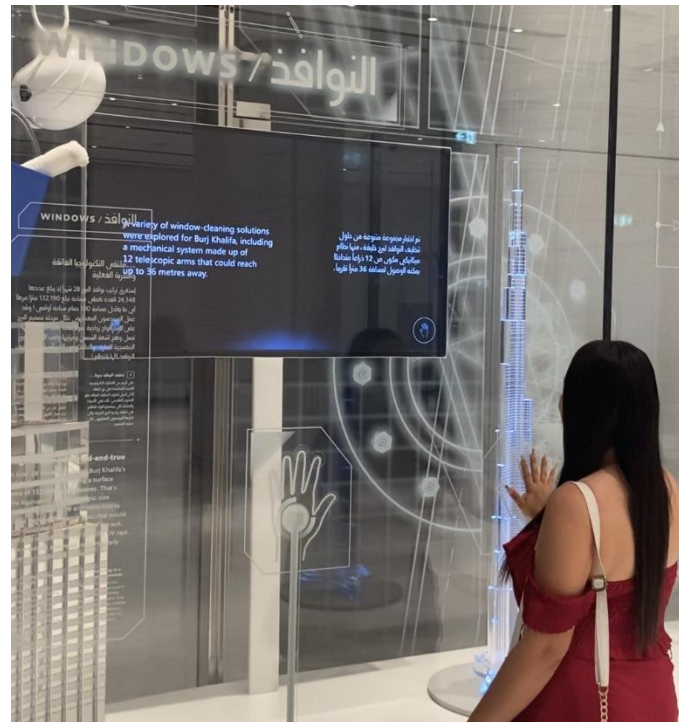
Figura 4 Tecnología en el Burj Khalifa.

Nota. Imagen fotográfica tomada por el autor