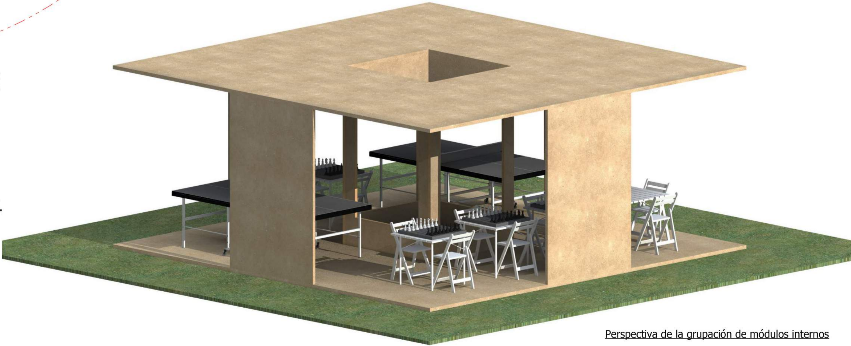
Perspectiva de la grupación de módulos internos

Despliegue de módulos internos, basados en el concepto de agrupación de elementos pequeños para formar un gran conjunto, el proceso de agrupación y abertura se realiza gracias al manejo de bisagras y como la cubierta es de baja densidad se conecta por el sistema de "macho y hembra", reduciendo costos en la producción