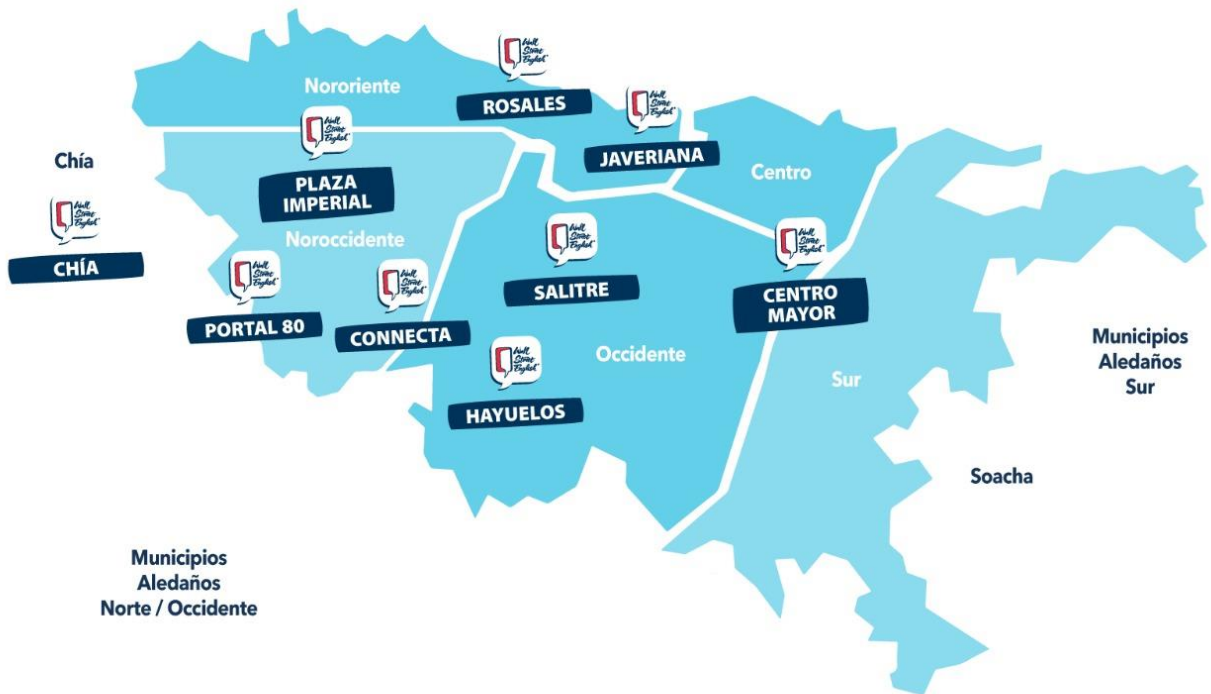
Figura 1. Ubicación Geográfica

Nota: Adaptada de [Ubicación geográfica sedes Wall Street English] de Wall Street English .s.f.