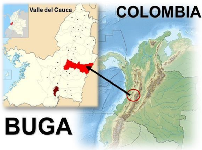
Mapa 1. Ubicación de la ciudad de Buga en Colombia y en el Valle del Cauca.

Fundada en el año de 1991, la Fundación tiene como objetivo social “responder de forma integral a las necesidades y problemáticas que presentan las personas en situación de calle”, buscando proveer la alimentación básica y el alojamiento. También se brinda hospedaje a los familiares de pacientes que se encuentren en el hospital o clínicas de la ciudad que vengan de veredas o pueblos circunvecinos.