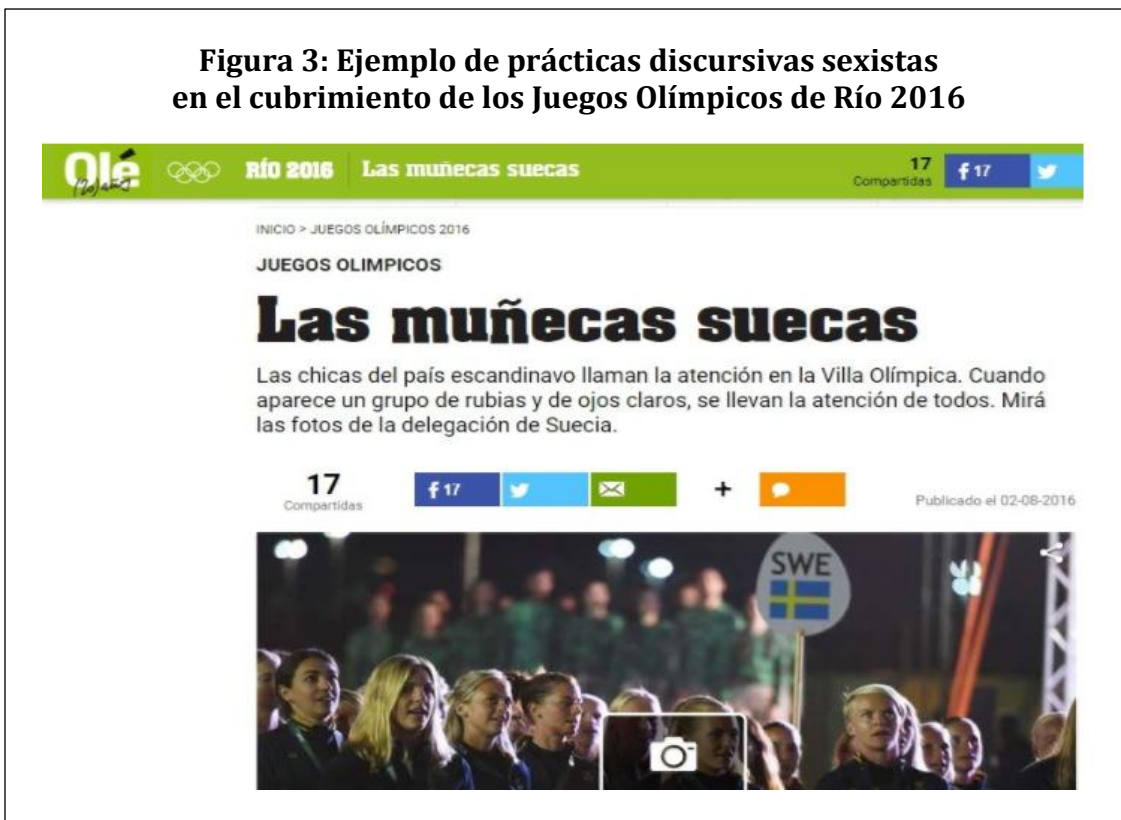
Figura 3: Ejemplo de prácticas discursivas sexistas en el cubrimiento de los Juegos Olímpicos de Río 2016

En este ejemplo, tomado del medio argentino Olé se ve cómo se refiere a la delegación femenina de Suecia como 'Muñecas suecas', en alusión a sus características físicas de pelo rubio y sus ojos claros. Esta descripción enfatiza en el impacto que generó en los espectadores la belleza de estas mujeres y que pone en un segundo plano su rendimiento deportivo que, para los propósitos del evento deportivo y del medio que lo cubre, es lo que se debería primar.