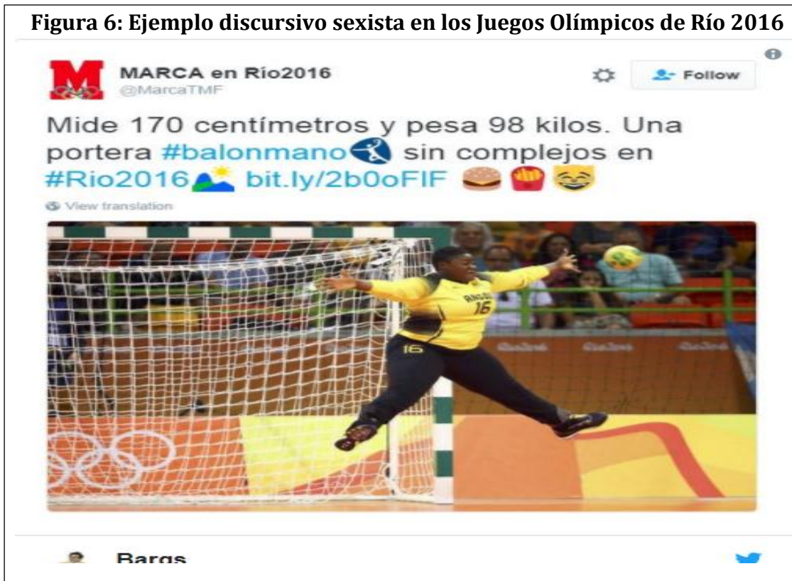
Figura 6: Ejemplo discursivo sexista en los Juegos Olímpicos de Río 2016

En este trino del diario MARCA sobre los Juegos Olímpicos se ve cómo representan a la mujer por sus características físicas que nada tienen que ver con el rendimiento deportivo de esta atleta de balonmano que se encontraba disputando un partido en esta competencia.