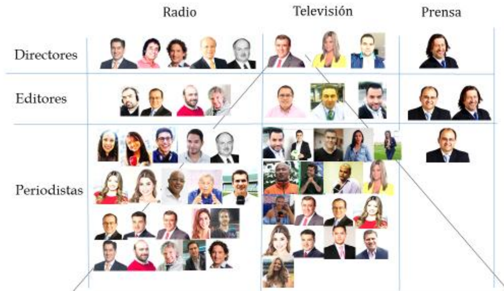
Figura 2: Composición del campo periodístico deportivo bogotano, por medios y jerarquías

Allí se encontró que hay una predominancia de hombres sobre mujeres con un balance general de aproximadamente tres a uno: treinta del género masculino y tan solo once del género femenino.