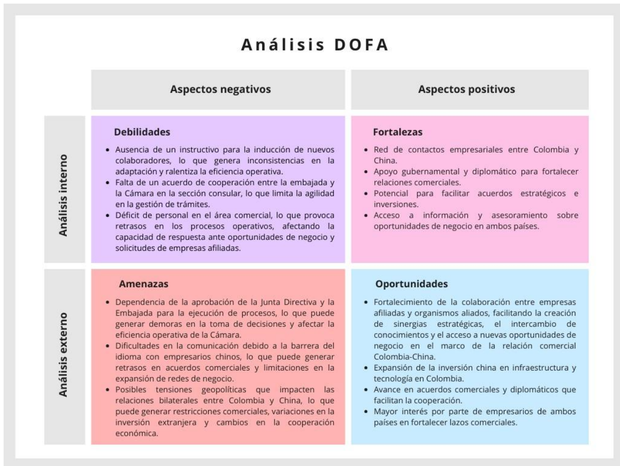
Figura 5 Matriz DOFA