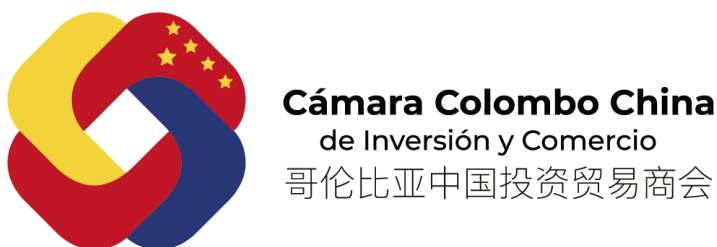
Figura 1 Logo de la Cámara Colombo China de Inversión y Comercio.

Nota: CCCHIC, 2024, Logo de Cámara Colombo China de Inversión y Comercio.