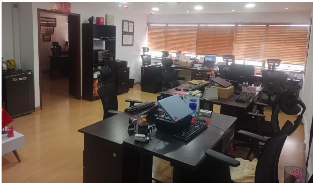
Figura 2 Oficina Cámara Colombo China de Inversión y Comercio.

Nota: CCCHIC, 2024, Fotografía de la oficina de la Cámara Colombo China de Inversión y Comercio.