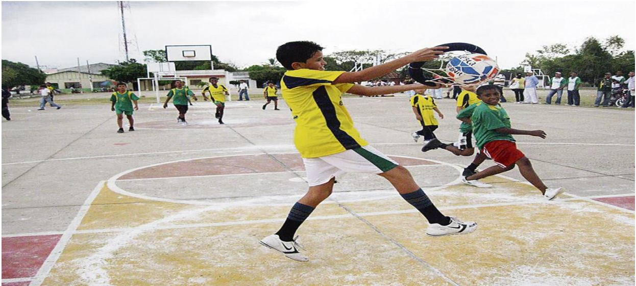
Imagen 1. Explicación visual de la actividad.