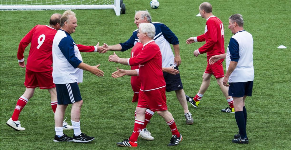
Imagen 4. Explicación visual de la actividad.