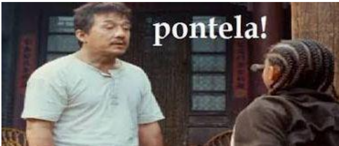
Imagen 2. Explicación visual de la actividad.