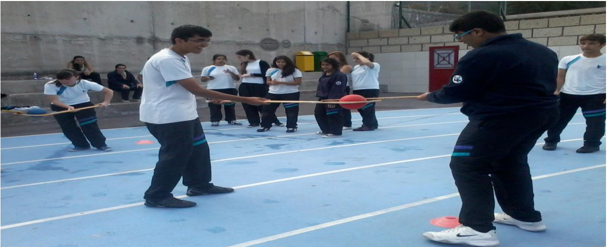
Imagen 5. Explicación visual de la actividad.