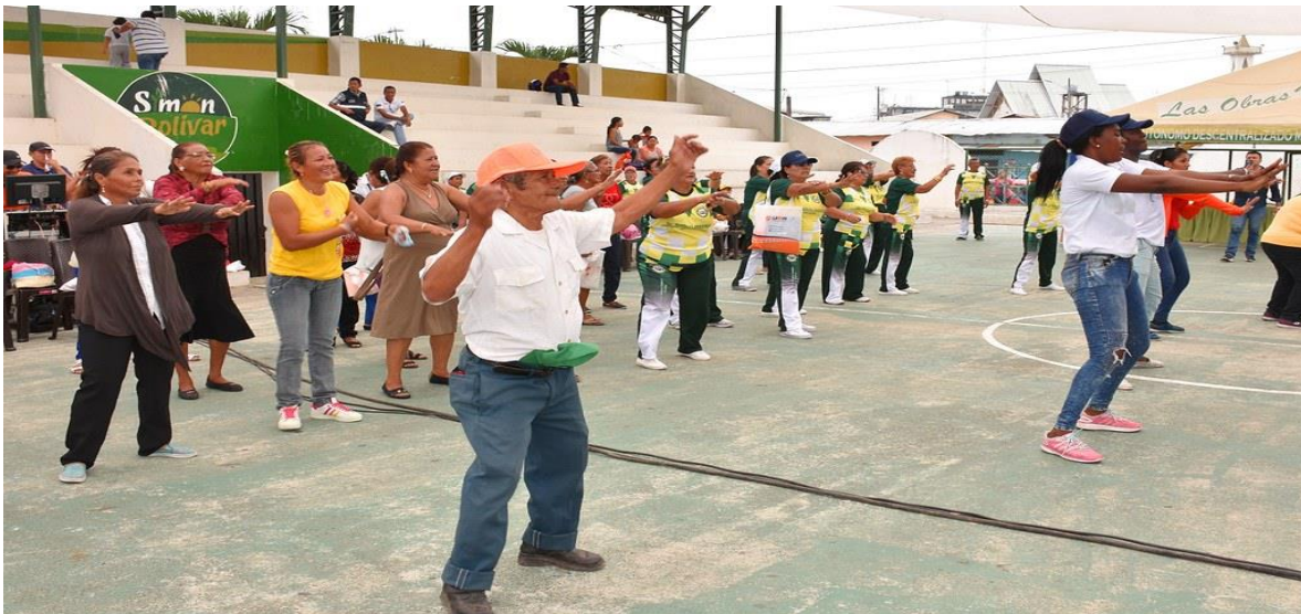
Imagen 3. Explicación visual de la actividad.