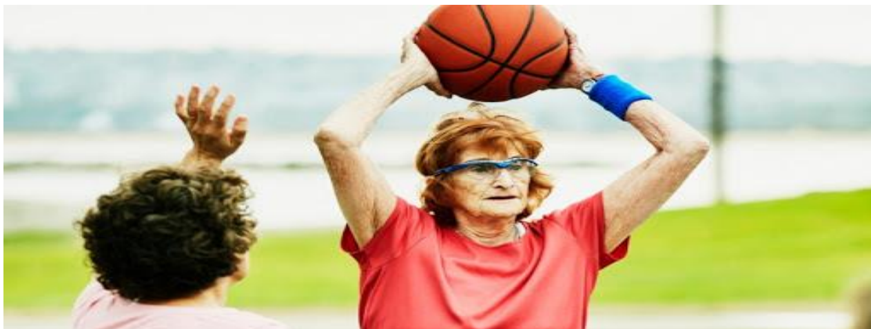
Imagen 6. Explicación visual de la actividad.