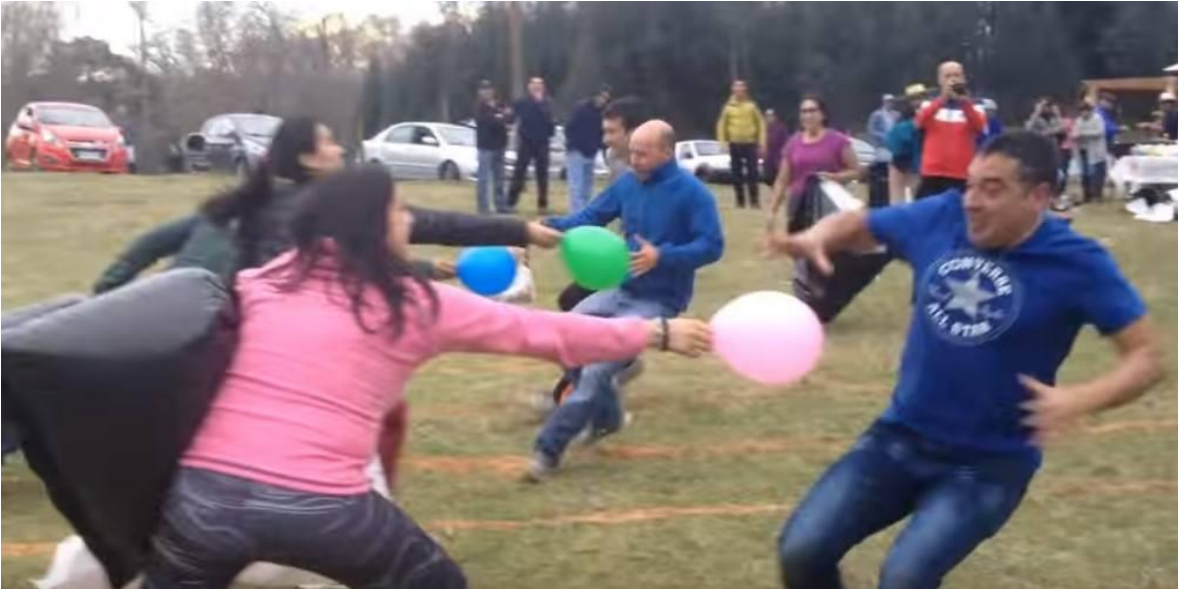
Imagen 7. Explicación visual de la actividad.