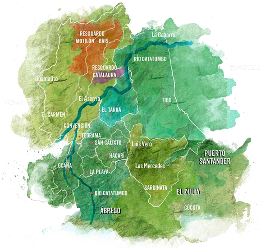
Figura 1. Mapa de la región del Catatumbo