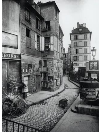
Figura 8: Fotografía des Ursins, 1900 de Eugène Atget, rue.

Nota: tomada del profesor de fotografía (29 de febrero 2024).