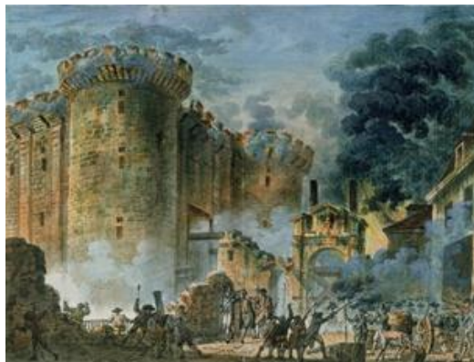
Figura 3: La toma de la Bastilla, 14 de julio de 1789, Jean Pierre Houel, Musee de la ville, Paris