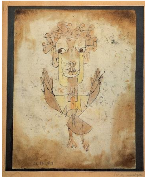
Figura 7: Pintura Angelus Novus (1897-1940), Paul Klee. Museo de Israel, Jerusalén.