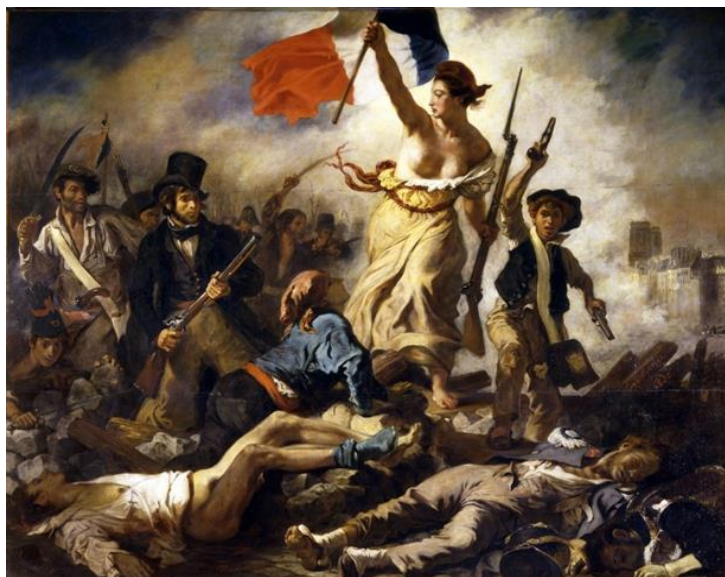
Figura 1: Pintura " La Libertad guiando al pueblo " (1830), Eugene Delacroix, Museo del Louvre, París