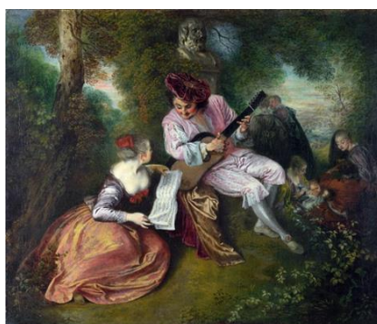
Figura 2: Picture The scale of love ( 1715- 1718), Jean-Antoine Watteau, National Gallery, London.

Nota: tomada de página oficial National Gallery (09 de abril 2024)