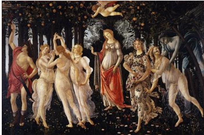
Figura 6: Alegoría de la primavera, Sandro Botticelli, (1477-1478), Galería Uffizi, Florencia.

Nota: tomada de Wikipedia el 13 de abril de 2024.