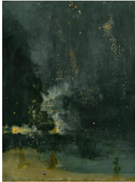
Figura 9: Nocturno en negro y dorado – The Falling Rocket (1872-1877), James McNell Whistler, Instituto de arte de Detroit, Detroit.

Nota: tomado de Ideelart. (4 de mayo de 2024).