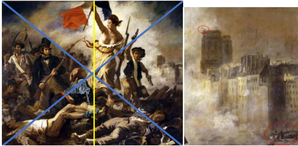
Figura 5: Espacio de la escena y Catedral de Notre Dame, París.

Nota: Imagen derecha: ampliación del espacio derecho de la obra. Imagen izquierda: Ejes diagonales y vertical.