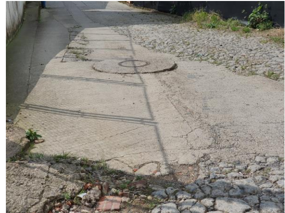
FOTOGRAFIAS 16, 17, 18, 19: OBRAS DE SEGURIDAD VIAL EN EL CENTRO URBANO DEL MUNICIPIO DE MARIPI. (FOTOGRAFIAS DILIGENCIA DE INSPECCIÓN).