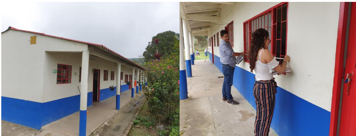
FOTOGRAFIAS 26, 27: ESCUELA DE LA VEREDA___ EN EL MUNICIPIO DE MARIPI. (FOTOGRAFIAS DILIGENCIA DE INSPECCIÓN).