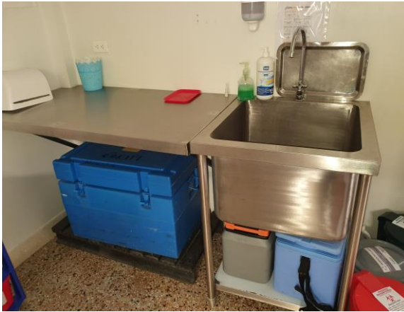
FOTOGRAFIAS 7, 8, 9: ESTADO ACTUAL CENTRO DE SALUD DEL MUNICIPIO DE MARIPI (FOTOGRAFIAS DILIGENCIA DE INSPECCIÓN).