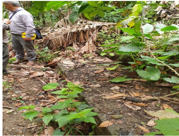
FOTOGRAFIAS 22, 23: POZO PROFUNDO PARA FAMILIAS EN ZONAS DE ALTO RIESGO. (FOTOGRAFIAS DILIGENCIA DE INSPECCIÓN).