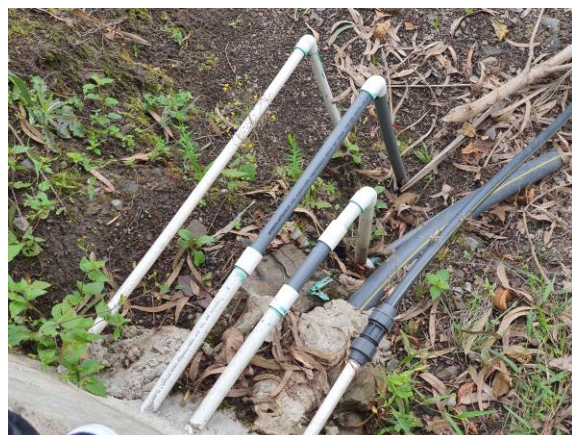
FOTOGRAFIAS 28.29: TANQUE DE ALMACENAMIENTO Y LÍNEA DE ADUCCIÓN. (FOTOGRAFÍAS DILIGENCIA DE INSPECCIÓN)-

El presente informe se soporta en los documentos entregados durante la diligencia de inspección en una (1) carpeta correspondiente a la obra pública celebrados en el municipio de Maripi ejecutados en el año 2018,