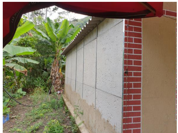
FOTOGRAFIAS 20, 21: CASA PREFABRICADA EN VEREDA DE MARIPI. (FOTOGRAFIAS DILIGENCIA DE INSPECCIÓN).