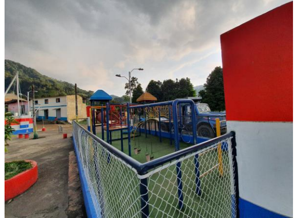
FOTOGRAFIAS 10, 11: PARQUE PRINCIPAL DEL MUNICIPIO DE MARIPI. (FOTOGRAFIAS DILIGENCIA DE INSPECCIÓN).