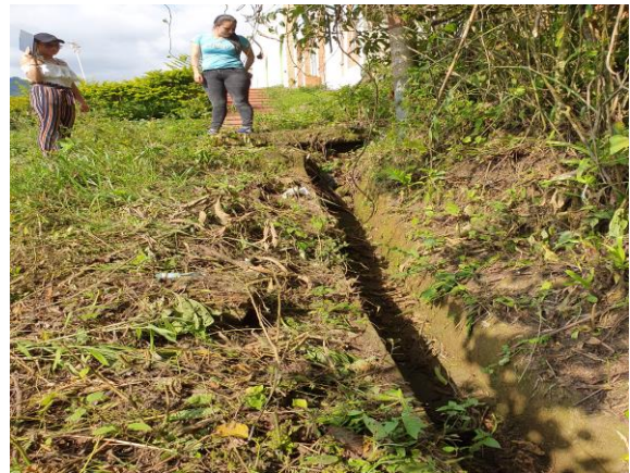
FOTOGRAFIAS 24, 25: INSPECCION DE ACUEDUCTO URBANO, MARIPI. (FOTOGRAFIAS DILIGENCIA DE INSPECCIÓN).