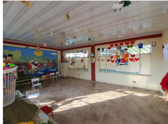
FOTOGRAFIAS 1, 2: ESTADO ACTUAL DE PARQUE DEL JARDIN INFANTIL Y LO VENTILADORES EN CADA SALON. (FOTOGRAFIAS DILIGENCIA DE INSPECCIÓN).