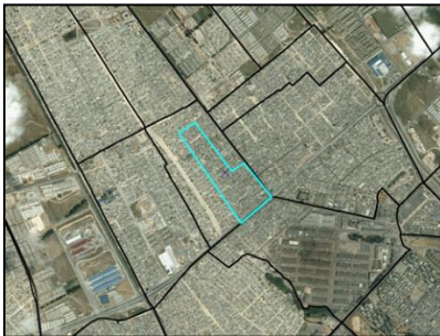
Figura 1. Barrio Patio Bonito I

El barrio se llama Patio Bonito I y se localiza en la periferia suroccidental de Bogotá. Surgió a comienzos de los años setenta del siglo pasado y después de varias décadas ha experimentado un proceso de densificación y crecimiento de la población inquilina que llegaba al 65% para el momento de la investigación. En el conjunto de la ciudad este barrio había vivido todo un proceso de mejoramiento y valorización debido a la expansión de redes de transporte y de infraestructura pública y privada (Díaz, 2003). Las actividades económicas ligadas especialmente a su proximidad con una plaza de mercado de escala metropolitana se fueron diversificando al surgir una centralidad de comercio popular y circuitos de economías ilegales, una zona de prostitución, etc.