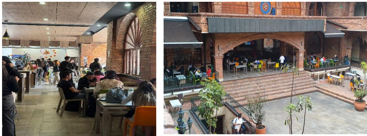
Imagen 2. Cafetería principal Universidad Santo Tomás

4. Hay comentarios sobre el físico y las formas de vestir de los hombres. Incluso miradas y burlas hacia aquellos que tienen una apariencia poco “masculina”. Entiéndase esta como una apariencia ruda, distante de conductas que se han asociado a la mujer.