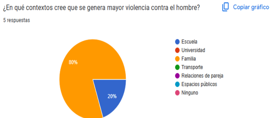
Ilustración 4. Encuesta violencia contra el hombre

•El 20% de los encuestados afirmó haber experimentado algún tipo de violencia hacia hombres en contextos universitarios.\