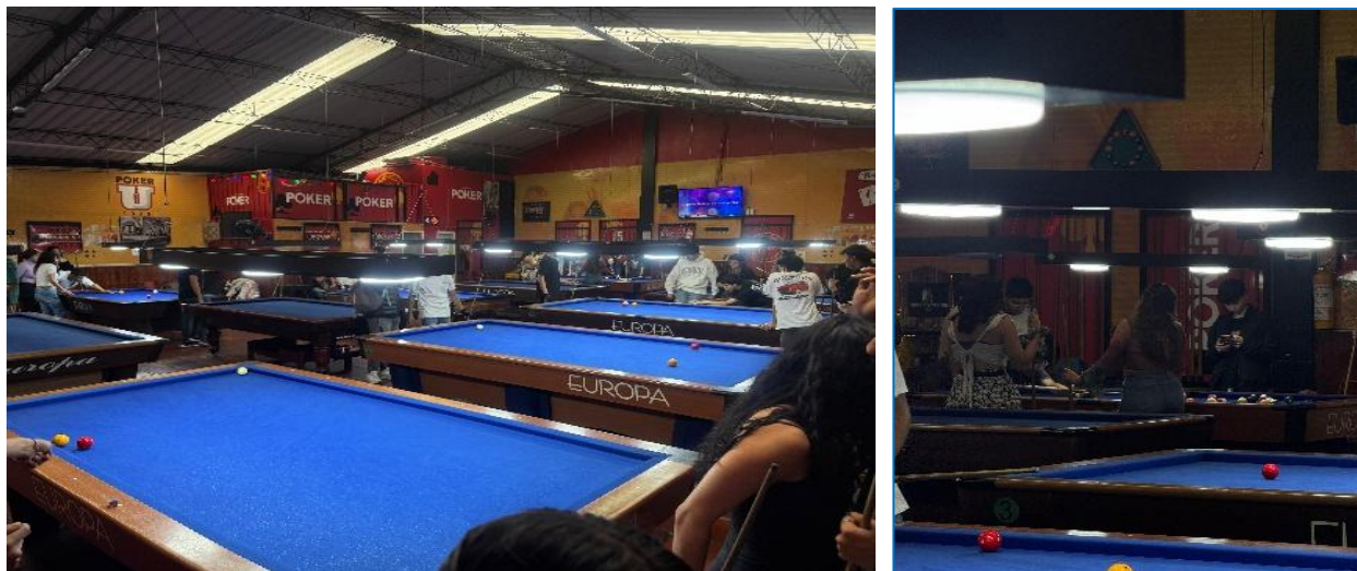
Imagen 1. Bar Divermanía 51.

Así, se encontró que, en el bar, los hombres tienen que pegarles a las pelotas como “hombres”, aquellos tiros que se hagan de forma sutiles se consideran como tiros: “de loca” “débiles” o incluso de “marica”. Si el hombre no tiene la habilidad suficiente para entender el billar es una “loca”. El uso del taco de billar se presta para abstracciones “imaginativas” en donde, si el taco se toma de cierta forma, se suelen hacer acepciones fálicas o propias del miembro masculino. El hombre que no acompañe el juego de billar con una cerveza es “mucho loca” o sencillamente no tiene el espíritu masculino que debería de tener en este tipo de “juegos”.