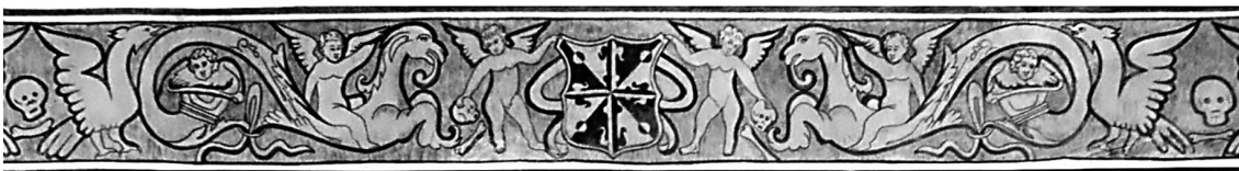
Figura 7. Grutesco del exconvento de San Juan Bautista Tetela del Volcán, Morelos, México