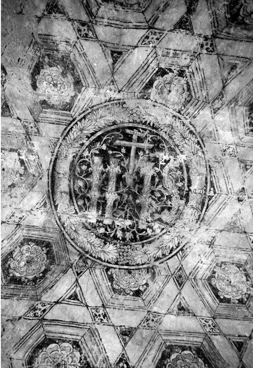
Figura 5. Diseño de casetones con un anagrama de Jesús (IHS), en la bóveda de cañón corrido del claustro bajo del exconvento de La Asunción de María, Yautepec, Morelos, México