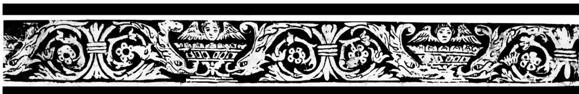
Figura 6. Grutesco del exconvento de La Asunción de María, Yautepec, Morelos, México

Estos diseños acompañaron epígrafes en latín, los cuales servían para que el fraile meditara sobre un aspecto de la Biblia. En la actualidad solo se conservan epígrafes en latín en dos conventos dominicos del Altiplano Central: Oaxtepec (estado de Morelos) y Chimalhuacán-Chalco 4 (estado de México). En el primero, los epígrafes del refectorio tienen las siguientes frases 5 :