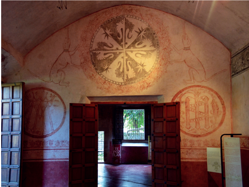
Figura 15. Escudo dominico flanqueado por los domini canis , en la pintura mural de la portería del exconvento de La Natividad, Tepoztlán, Morelos, México.

el Gobierno; con lo cual, los mendicantes poco a poco se alejaban del sueño de un mundo donde se integrara al indígena, y su labor se veía como un lastre de los antiguos tiempos.