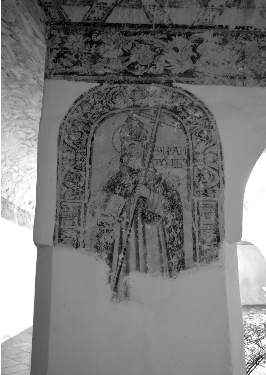
Figura 9. Representación de san Antonino en un contrafuerte del claustro bajo del exconvento de La Asunción de María, Yautepec, Morelos, México