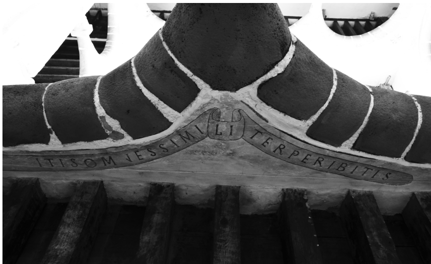
Figura 8. Cartela con epígrafe en latín donde se lee HA[BVER]ITIS OM[N]ES SIMILITER PERIBITIS, ubicado en la arcada este del claustro bajo del exconvento de San Vicente Ferrer, Chimalhuacán-Chalco, estado de México, México