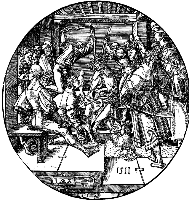
Figuras 10 y 11. Grabado La coronación de espinas , de Jacob Cornelisz van Oostsanen y pintura mural que representa la misma escena en el claustro bajo del exconvento de Santa María Magdalena, Tepetlaoxtoc, estado de México, México