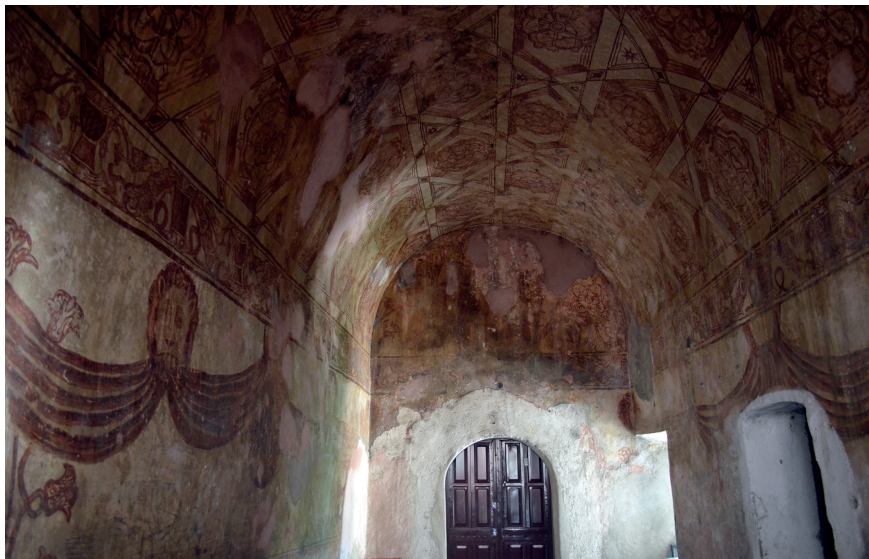
Figura 13. Pintura mural del exconvento de San Miguel Arcángel, Morelos, México

de los grabados, manifestándose cada vez más la habilidad del artista indígena para representar los programas pictóricos requeridos por el español, sin necesidad de emplear una imagen como inspiración.