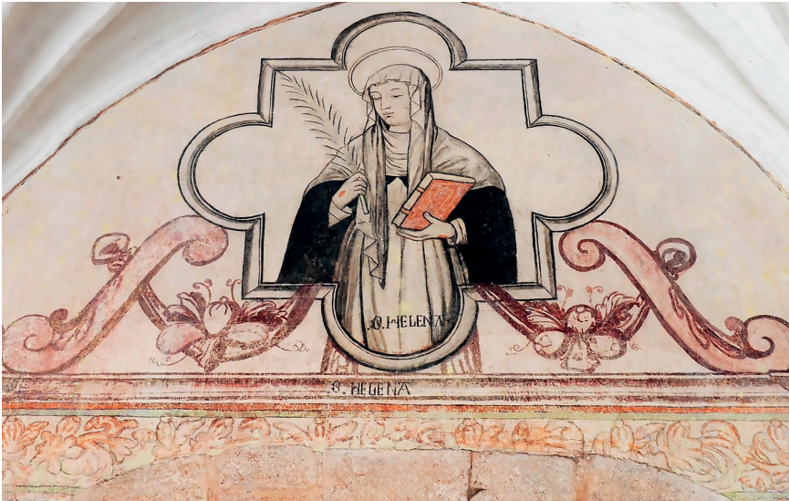
Figura 14. Representación de Santa Elena en la pintura mural del claustro bajo del exconvento de Santo Domingo de Guzmán, Izúcar, Puebla, México. Nótese cómo la capa pictórica policroma se superpone sobre la pintura de color rojo

en la siguiente etapa pictórica los santos de color rojo se cubrieron, y aunque se respetó la misma forma, se les dieron colores encarnado, verde, azul, anaranjado y ocre, para hacer más vistoso el convento. Lo mismo sucedió en el convento de Tetela del Volcán, donde se ha descubierto que detrás de las pinturas policromas se encontraban las mismas figuras, pero en color rojo.