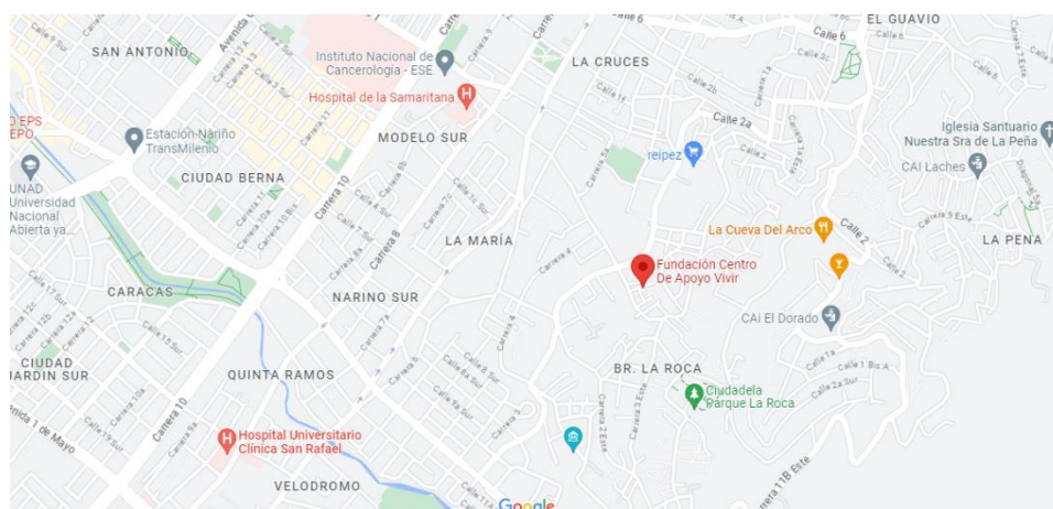
Imagen 2: Ubicación Barrio el Balcón

Para dar un contexto más específico en cuanto a la ubicación territorial de la asociación centro de apoyo vivir, se debe hablar sobre el barrio El balcón, este se encuentra dentro de la UPZ Lourdes, la cual se encuentra ubicada en el suroriente de la localidad en un estrato 1 y 2