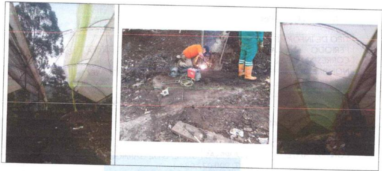
REGISTRO FOTOGRAFICO TOMADO DE INFORME DE SUPERVISIÓN

El Informe de Supervisión muestra archivo fotográfico de la reparación en tres (03) fotografías que se muestran a continuación: