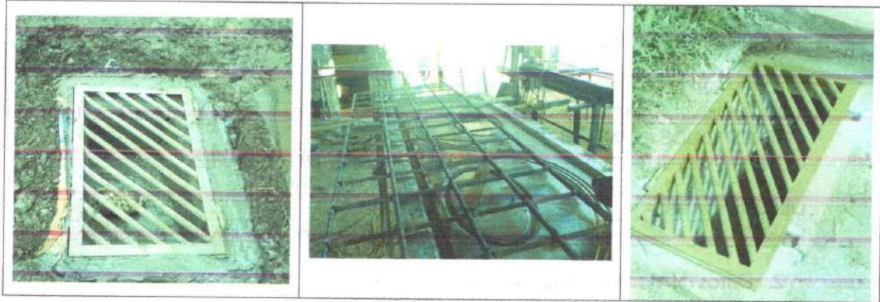
REGISTRO FOTOGRÁFICO TOMADO DE INFORME DE SUPERVISIÓN