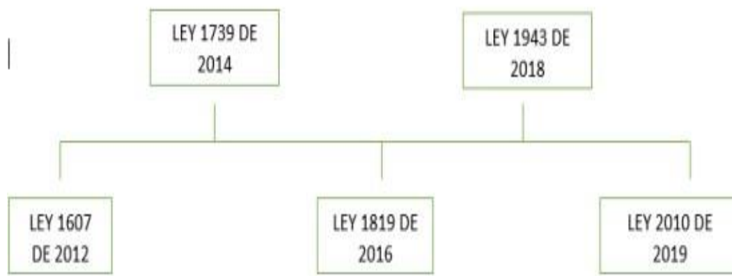
Figura 1. Mapa cronológico

Después de este cambio en el mundo de la tributación de personas naturales con ello se generaron nuevas exenciones entre las cuales está el exceso de salario básico de las fuerzas militares y policías.