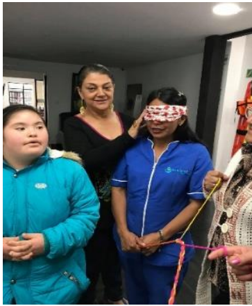
Figura 4. Taller: el reconocimiento de sí mismo

En el desarrollo del taller, quien dirigía el ejercicio preguntó a los participantes ¿de dónde venían? ¿cómo fue su llegada a Bogotá? y ¿cómo la FCM como les cambio la vida?, en este momento hubo algunas lágrimas, donde se recordó el pasado.