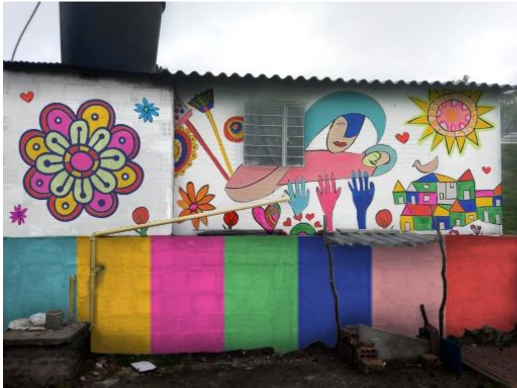
Figura 16. Representación identidad personal de Luz Dary García