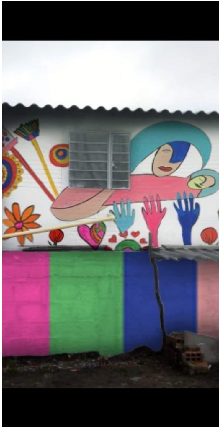
Figura 17. Representación identidad personal ilustración de las manos