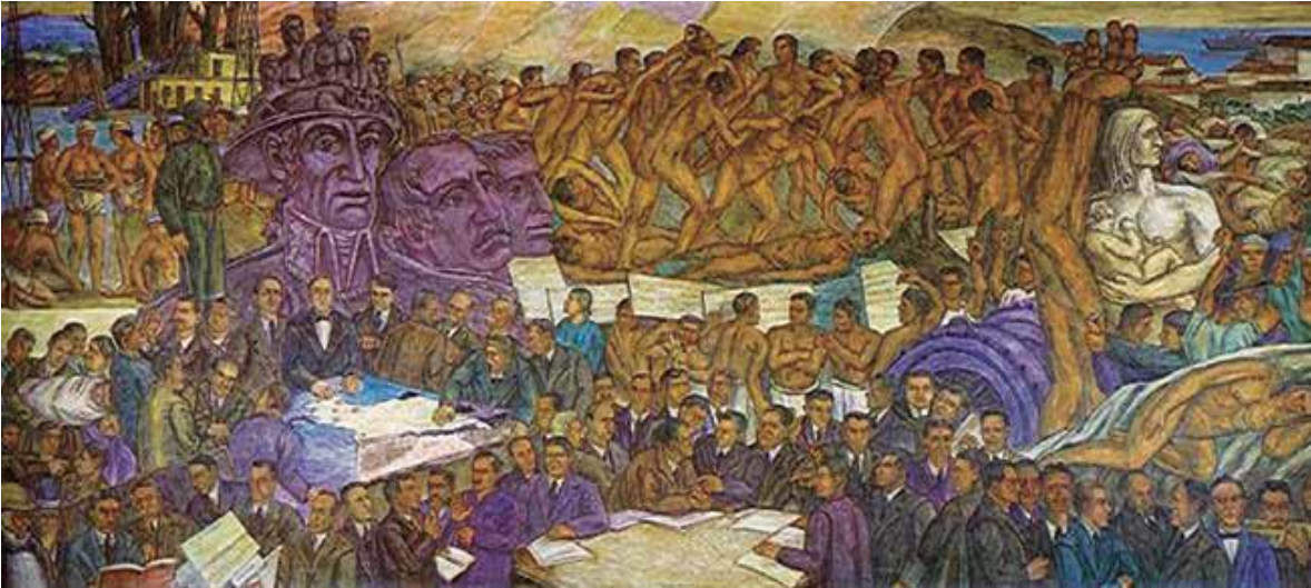
Figura 2. Pedro Nel Gómez, La República , 1937. Fresco. Antiguo Palacio Municipal, Medellín, hoy Museo de Antioquia 1 .

La obra del “Dorado” del artista Ramírez Villamizar fue, sin lugar a duda, el mural que de manera más clara encarnó la ruptura con la tradición muralista de los años treinta. (Franco, 2013)