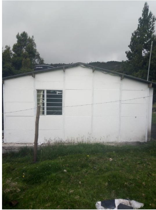
Figura 18. Fachada de casa previa a intervención.