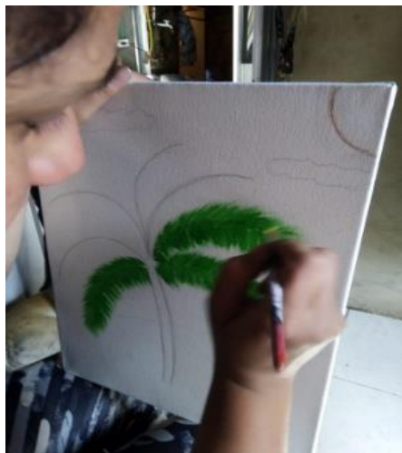
Figura 10. Representación de la palmera