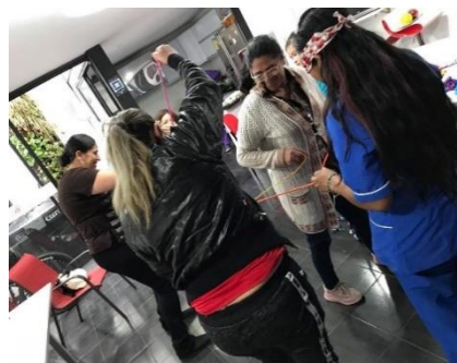
Figura 3. Taller: el reconocimiento de sí mismo.

El propósito de este ejercicio consistió en crear un espacio propicio para hablar de identidad, por ende, en dicha actividad se tiene como propósito trabajar elementos como la confianza, comunicación y el trabajo cooperativo. Ver figura 3 y 4.