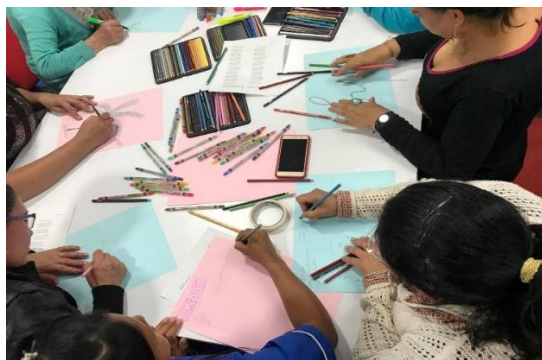
Figura 6. Taller: dibujo de la identidad personal

En el taller cada integrante representó a través de signo o símbolo su historia personal, todo enfocado a la identidad personal, mientras se dibujaba se empieza a contar lo que sentían y lo que ha significado su proyecto de vida, por ejemplo la señora blanquita dibuja su palacio y expresó “viví toda la vida de arrimada cuando mi vida mejoro y pudimos conseguir nuestra finquita la guerrilla nos desplazó, llegue a las goteras de Bogotá a vivir en hacinamiento en un cuarto, pero afortunadamente pude conseguir un lote donde la FCM me hizo mi casa, que para mí es un palacio, cada que vez que me dicen, que es muy linda mi casita, yo les respondo, mi casita no, “Mí Palacio”. Agrega también “somos personas adultas y nunca pensamos que nuestra vejes tuviéramos una tranquilidad de tener un techo digno donde vivir la FCM me lo ha dado todo” Ver figura 7