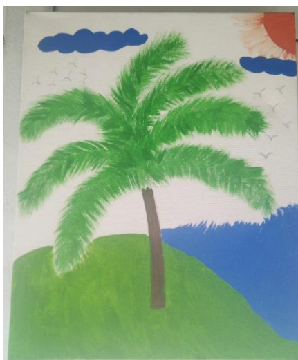
Figura 11. Representación de la identidad personal sobre lienzo

En el desarrollo del proceso de creación e investigación ha sido posible reflexionar sobre el concepto propio 3 de identidad personal, lo que llevo a la elaboración y propuesta de creación de una pintura mural en el que se plasman concepciones personales y la relación con el proyecto de la fundación Catalina Muñoz,