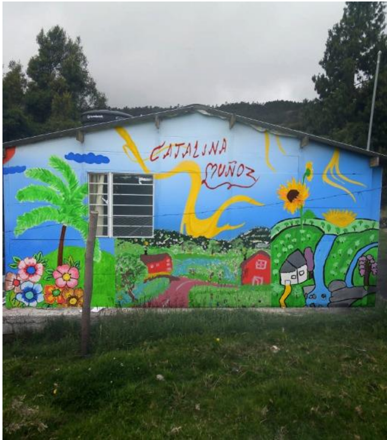
Figura 15. Representación final madres cabezas de familia