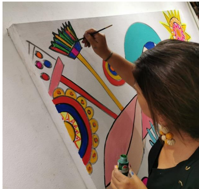
Figura 13. Representación del pincel