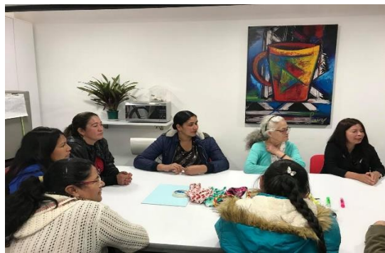
Figura 5. Taller: dibujo de la identidad personal

En otro momento de creación cada una de las madres cabeza de familia hizo la creación de un dibujo que representaba su historia de vida, para dicho ejercicio se pide que cada una de las personas dibujen algo con lo cual se identifican personalmente. Ver figura 5 y 6.