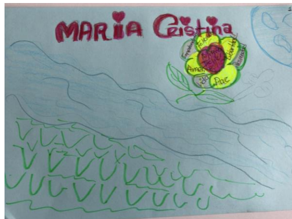
Figura 9. Representación de la identidad- Rio – Flor- tranquilidad.

Finalmente, en el proceso con las madres cabeza de familia se propuso la elaboración de una imagen en la que se plasmara su identidad personal, y para la cual se utilizó como soporte el lienzo y como pigmentos las pinturas acrílicas. Es así que fue necesario explicar elementos de composición y manejo técnico que incluyeron la teoría del color, combinación de colores, y también manejo de espacios. Dada la situación de emergencia sanitaria se sugiere trabajar desde casa debido al plan de contingencia y aislamiento preventivo por coronavirus momento. Ver figura 10 y 11.