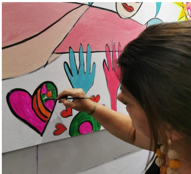
Figura 14. Representación de las manos

Para terminar, la descripción y explicación del proceso de creación artística, es importante señalar que en este momento está pendiente el ejercicio de plasmar el mural, no obstante, no ha sido posible por la situación de aislamiento preventivo emitido por el gobierno nacional frente a la emergencia por el coronavirus. 5