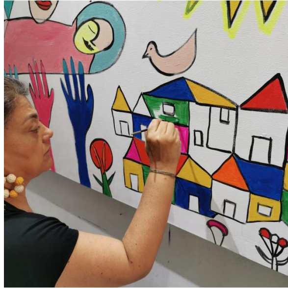
Figura 12. Representación de las casas.