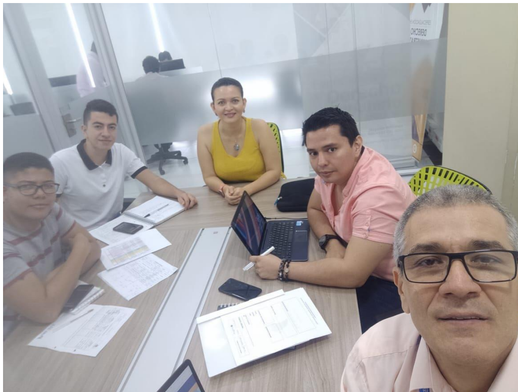
Anexos 6. Reunión con docentes de la USTA para el catálogo de productos del Meta