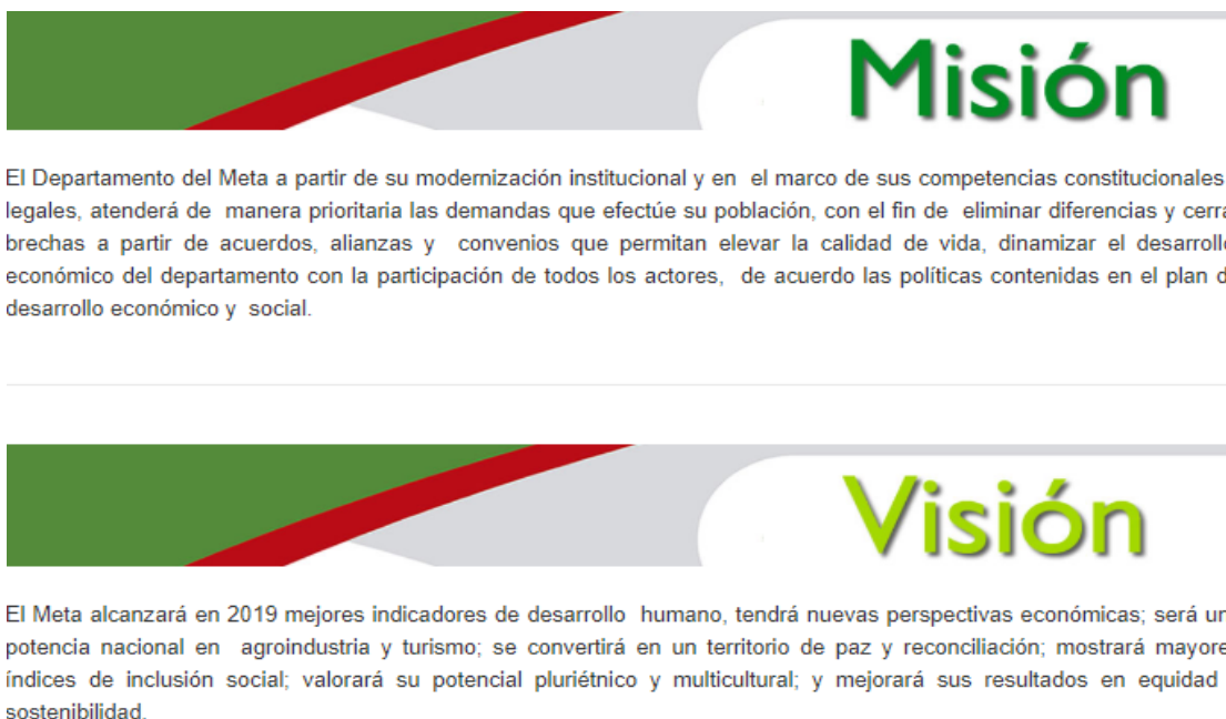
Ilustración 1. Misión y Visión, tomado de la página web, Gobernación del Meta, 2019

La Misión, Visión, Política de Gestión Integral y objetivo de Gestión Integral son algunos de los elementos estratégicos relevantes para la Gobernación del Meta ya que plasma los compromisos que tienen la gobernación en el departamento del Meta.