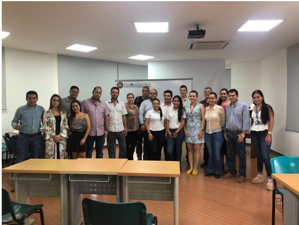
Anexos 5. Se realizó la preparación teórico práctico de negociación dirigido por la Facultad de Negocios Internacionales hacia los empresarios inscritos en la Macro Rueda Bicentenario