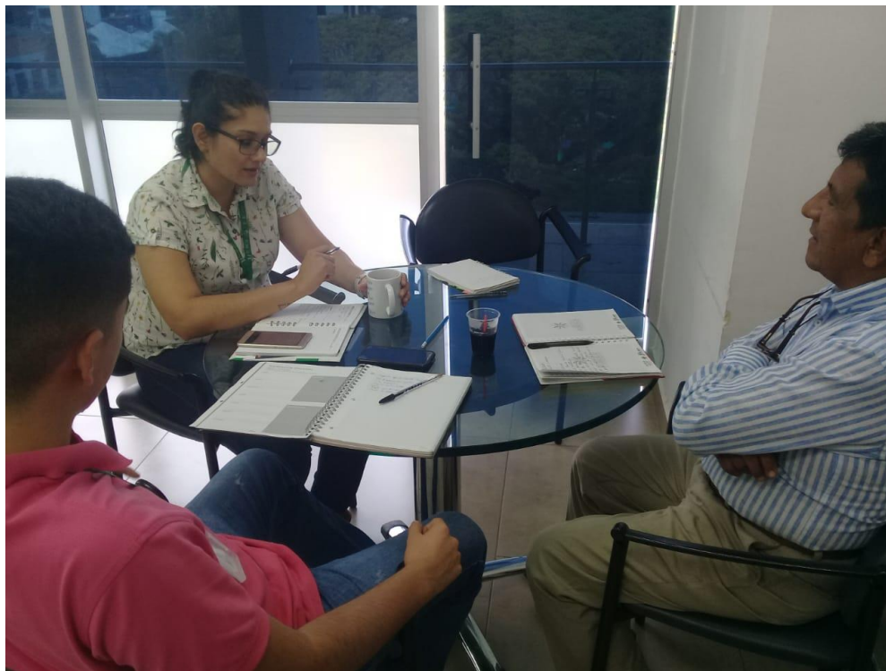
Anexos 1. Conociendo el caso de iniciativa exportadora enfocada en la miel de abejas para comercializar en China.