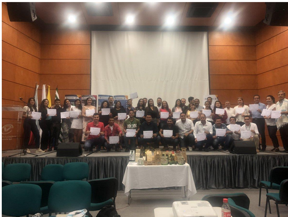
Anexos 3. Seminario “Diseñando su estrategia exportadora multisectorial” junto con Procolombia y Cámara de Comercio