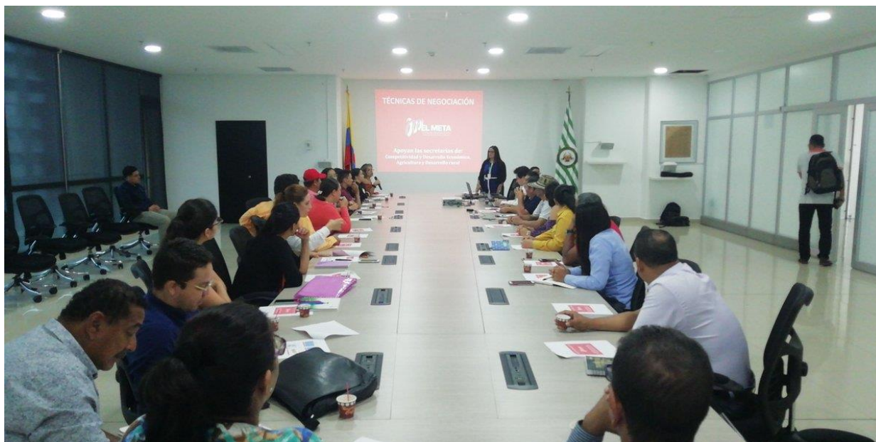
Anexos 2. Capacitación en técnicas de negociación dirigida a los vendedores de la Tercera Macro Rueda de Negocios del Meta