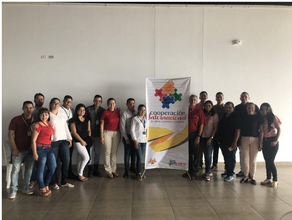
Anexos 4. Reunidos con empresarios exportadores con el fin de conocer las experiencias y los logros alcanzados en la Macro Rueda de negocios Bicentenario