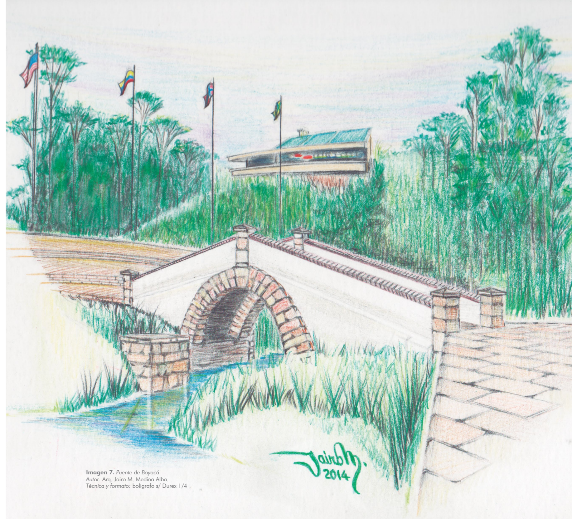
Imagen 7. Puente de Boyacá Autor: Arq. Jairo M. Medina Alba. Técnica y formato: bolígrafo s/ Durex 1/4

tallada y pulida. También fueron objeto de levantamiento con técnica de bolígrafo sobre papel (Dibujo N°32).