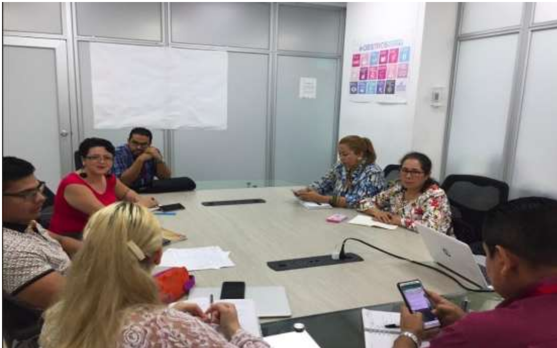
Figura 11. Segunda Mesa de Articulación con Asuntos Étnicos