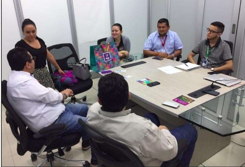
Figura 14. Reunión Bocoré y Asuntos Étnicos