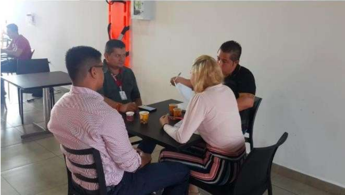
Figura 13. Reunión FINTRAC

producción de cacao, buscando por medio de su programa, en lo posible, dar una explotación a estos productos con el fin de generar recursos que beneficiaran a las comunidades.