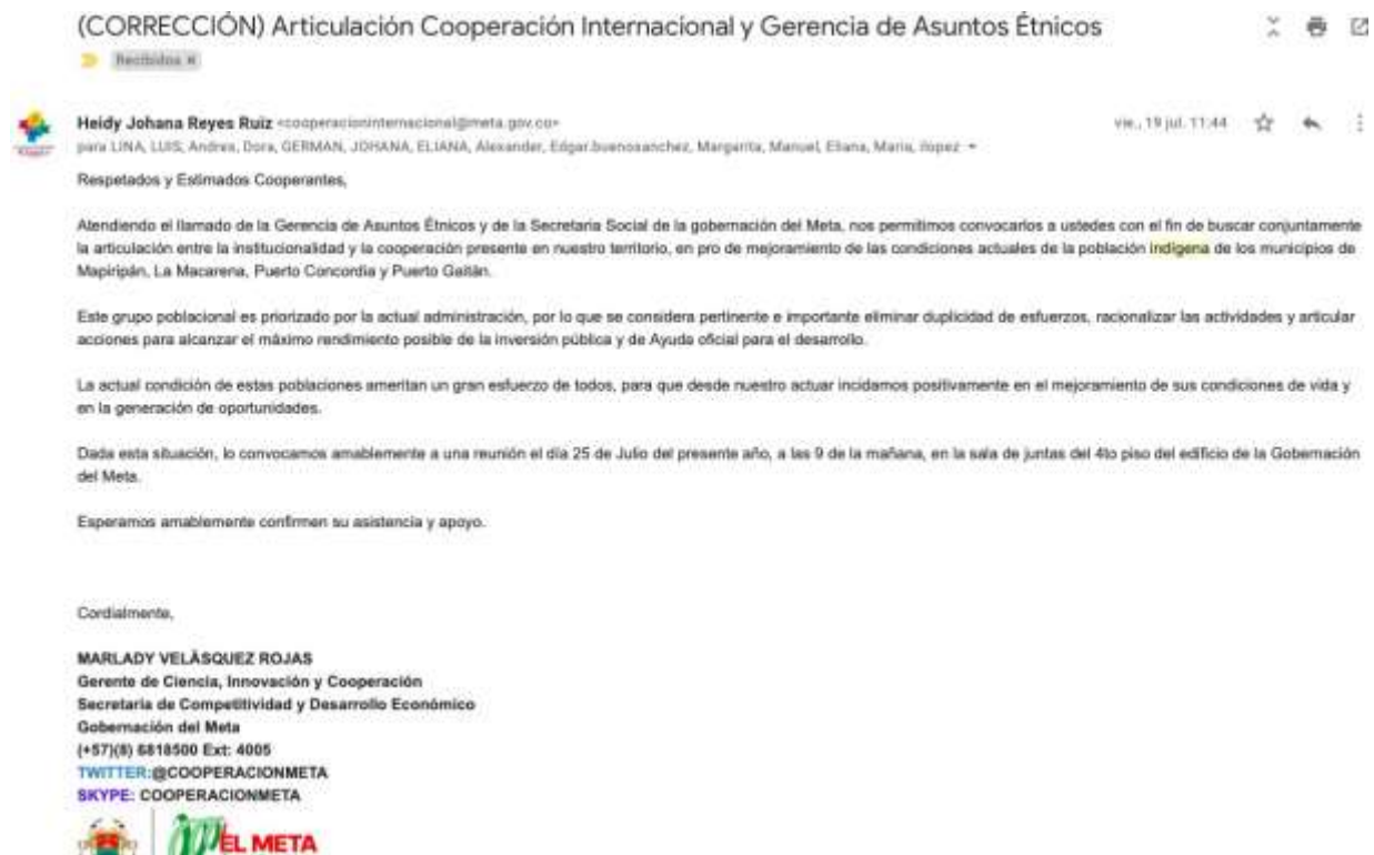
Figura 7. Convocatoria a Cooperantes, tomada del correo electrónico de la Gerencia de Ciencia, Innovación y Cooperación.