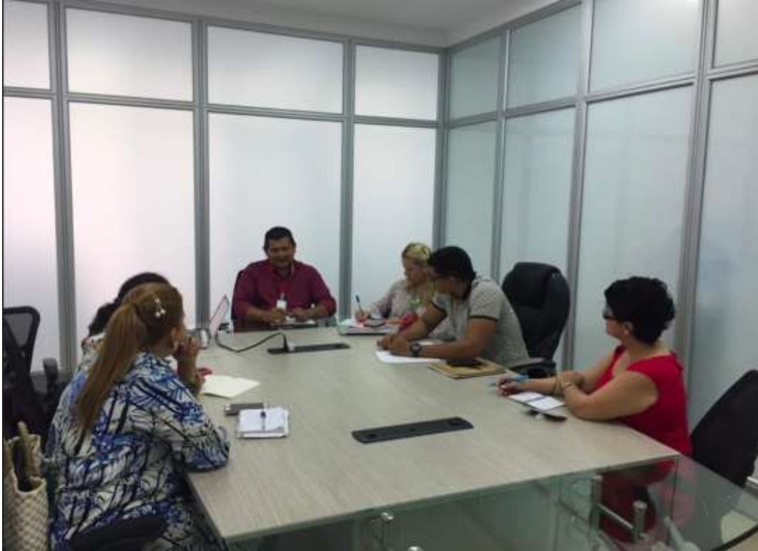
Figura 12. Segunda Mesa de Articulación con Asuntos Étnicos

Esta reunión contó con la presencia de dos delegados de la Universidad de los Llanos, las representantes de proyección social de la Universidad Cooperativa de Colombia y de la UNIMETA. El Gerente resaltó nuevamente la problemática de las comunidades y se estableció como cada una de las universidades podrían apoyar; la delegada de educación de la Universidad de los Llanos por su parte mencionó que su programa hacia presencia en una de las comunidades del municipio de Puerto Gaitán, tanto que las estudiantes en el territorio no contaban con las garantías mínimas para seguir realizando las prácticas profesionales junto con las comunidades indígenas. A pesar de la intención de colaboración por parte de las universidades no se llevó a cabo una tercera reunión para proyectar una agenda clara, determinando las actividades a realizar, en beneficio de las comunidades