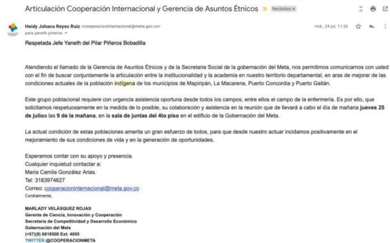
Figura 6. Convocatoria articulación Cooperación Internacional y Gerencia de Asuntos Étnicos, tomado del correo electrónico de la Gerencia de Ciencia, Innovación y Cooperación.

Como primera medida se procedió a buscar enlaces con las facultades de medicina y enfermería que hacen presencia en la región, se les comentó la problemática que enfrentaban las comunidades y se procedió a realizar una convocatoria a ellos y distintas entidades para el día 25 de julio de 2019.