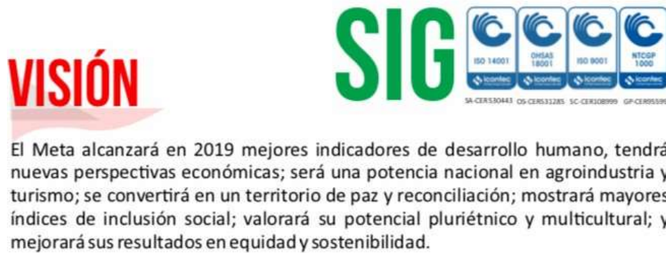
Figura 2. Visión 2015 - 2019 Gobernación del Meta, tomado de la Pág. Web de la Gobernación del Meta