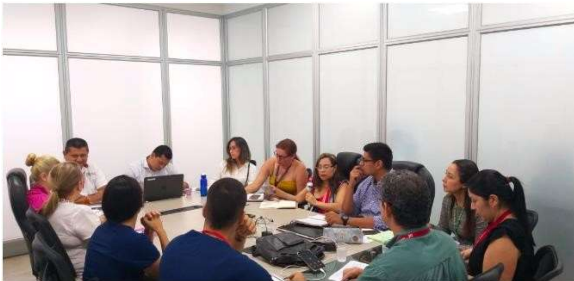
Figura 8. Mesa Indígenas 25 de Julio de 2019