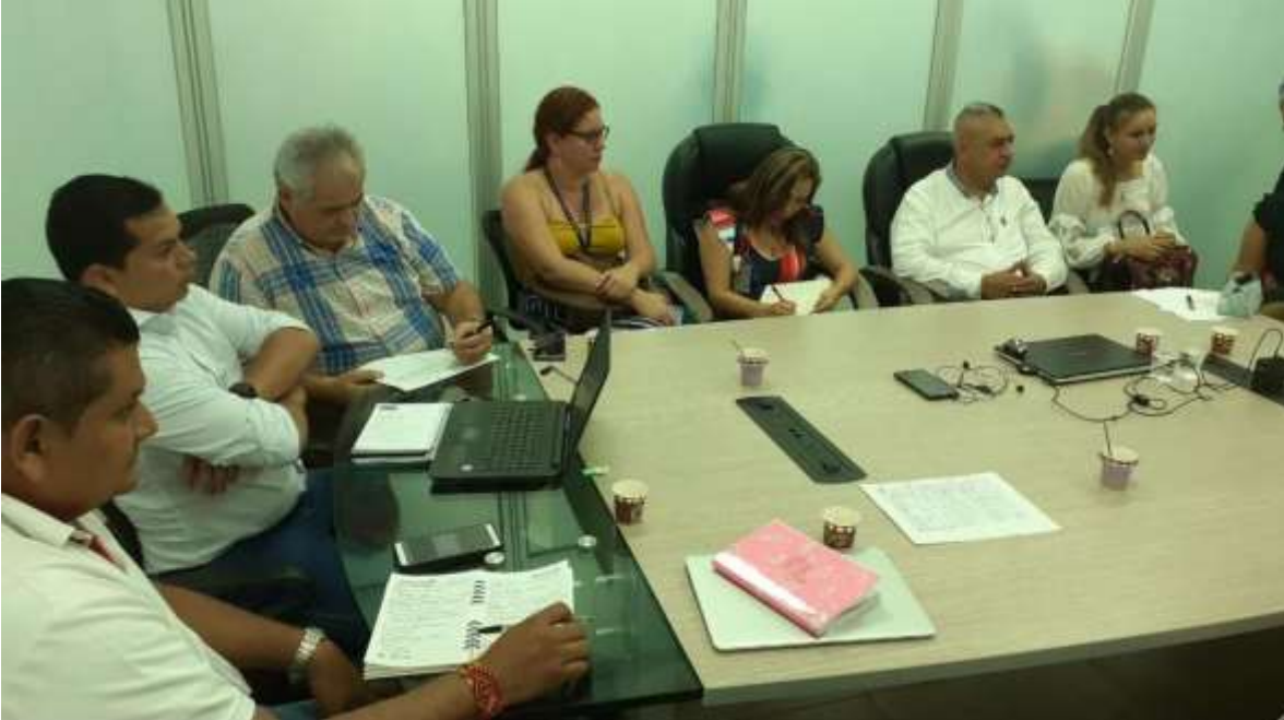
Figura 9. Mesa Indígenas 25 de Julio de 2019

La convocatoria logró una gran acogida, se contó con la presencia de delegados de las agencias de cooperación de GIZ y FUPAD, decanas y directoras de programa de Medicina, Enfermería y odontología de la Universidad Cooperativa de Colombia, estudiantes de enfermería de la Universidad de los Llanos y por último se logró la presencia de delegados de la ESE departamental, junto con el Gerente de la misma entidad.