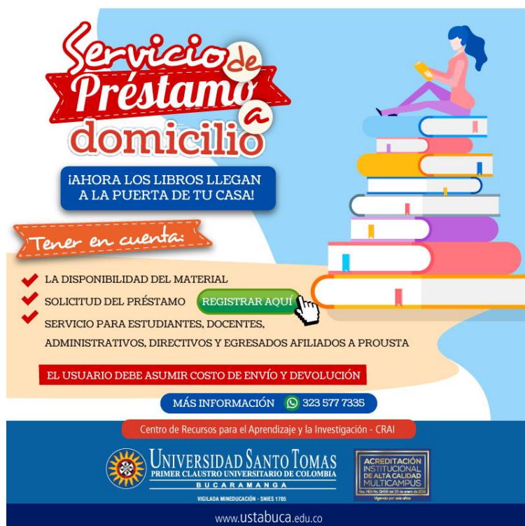
Imagen tomada de: Centro de Diseño e Imagen Institucional-CEDII